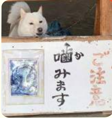
天沼なでしこちゃん (8歳) 白柴 特技: 鬼の顔面模写、輝く白い歯を 見せること