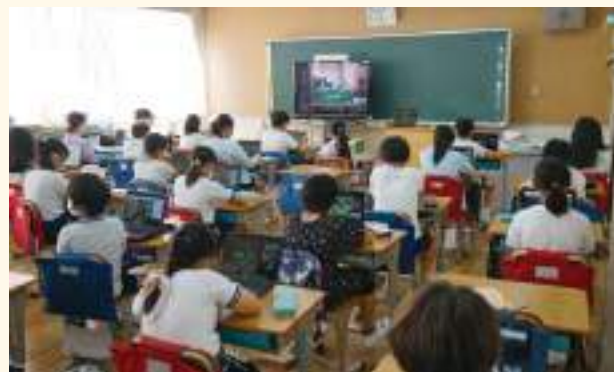
オンライン授業を受ける生徒たち