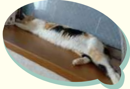
渡邊ビビちゃん (14歳) 三毛猫 特技: トイレに行った後、ニアーと報告しに来ます