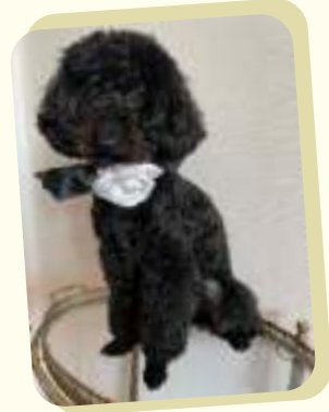
一色チャオくん (1歳) トイプードル 特技: キャッチボール