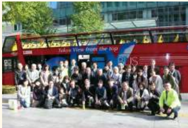
2階建てオープンバスの前で記念撮影

普段とは違った景色の東京を見た後は新丸ビルにあるシュラスコ料理店へ移動。大串で焼かれた塊肉を、自分たちの目の前で好きなだけ切り分けてもらうスタイルです。これ以上食べられないと思っても、焼きパイナップルを口にするとま