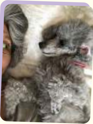
笠原キロちゃん (12歳) トイプードル 特技: 甘え上手